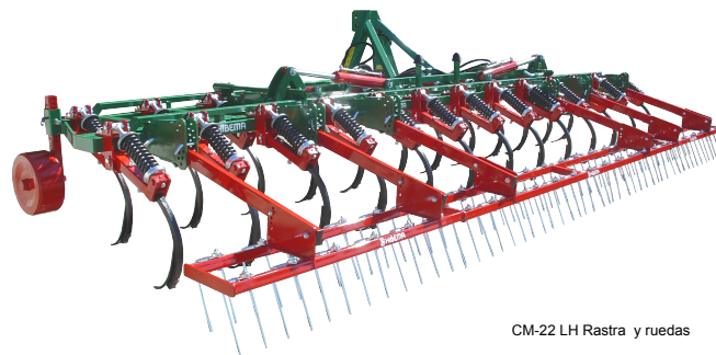
CM-22 LH Rastra y ruedas