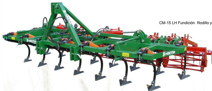
CM-15 LH Fundición Rodillo y Rastra