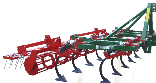
CM-11 L Rodillo y Rastra

www.hibema.es comercial@hibema.com fabrica@hibema.com