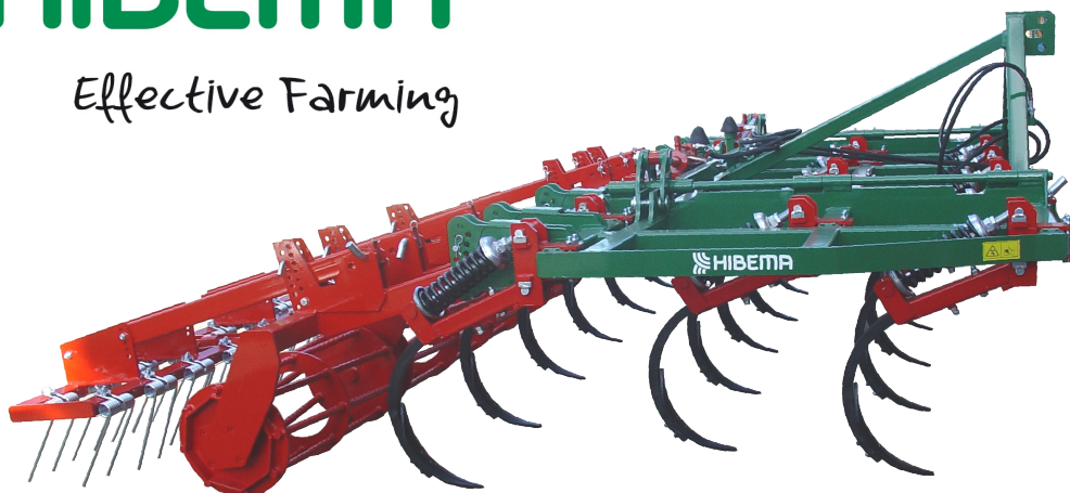
CM-19 LH 3F Rod. Y Rastra