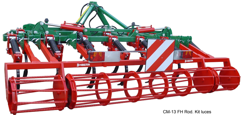
CM-13 FH Rod. Kit luces