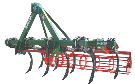
CM-9 F Rodillo (Cto.Fundición)