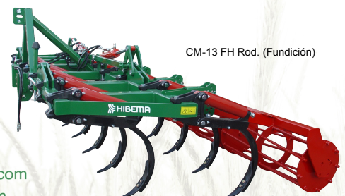
CM-13 FH Rod. (Fundición)