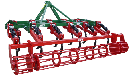
CM-11 FM Rod. Pleg. Manual