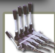
control por sirgas