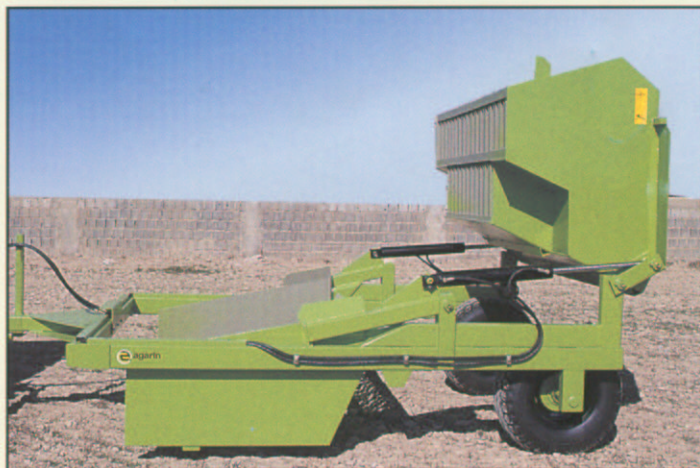
POSICION DESCARGA DE TOLVA