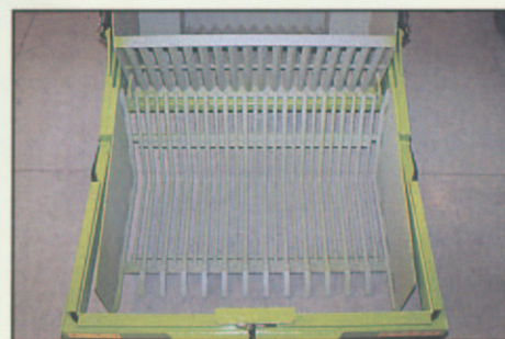
PARRILLA RECOGEDORA EN DISTINTAS POSICIONES