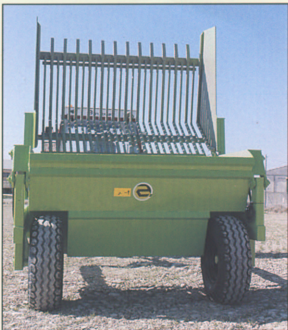
RUEDAS DE GRAN DIMENSIÓN PARA OBTENER BUENA RODADURA SOBRE TERRENOS BLANDOS.