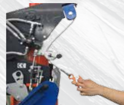
Cabestrante de 1 tonelada con sistema desenrollado automático.