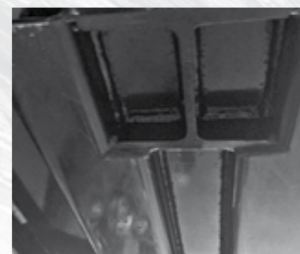
Chasis reforzado con doble soldadura.