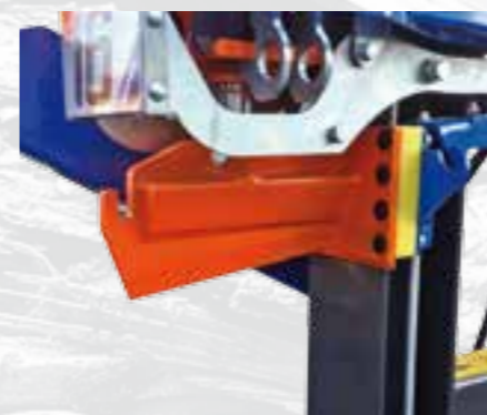
Cuchilla de corte de acero resistente DOMEX.