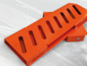
Soporte para motosierra.