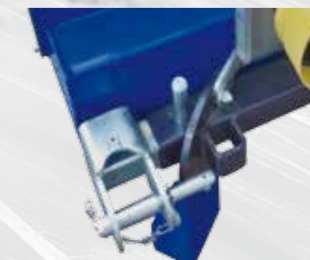
Enlace tripuntal ajustable.