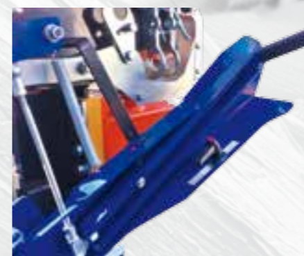
Palanca de control de libre movilidad.