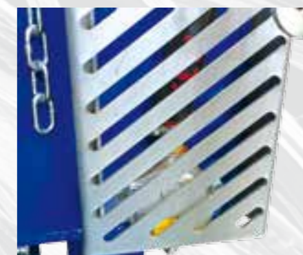
Filtro aceite protección.