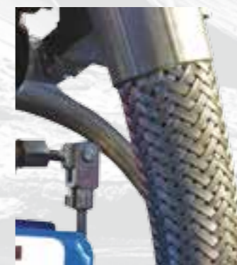
Tuberías hidráulicas revestidas de acero.