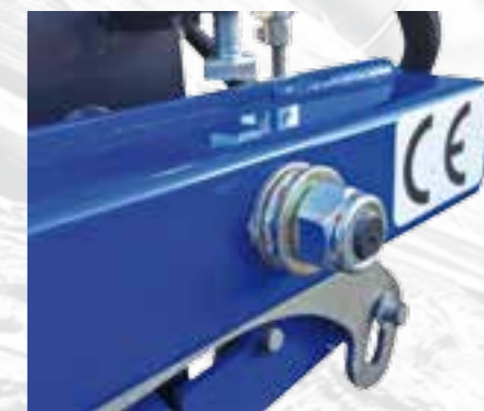
Cojinetes en las asas para una larga vida útil.