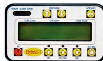
CAPTADOR AUTOMÁTICO DE ÁRBOLES CON CAUDALÍMETRO