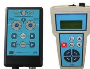
CAPTADOR AUTOMÁTICO DE ÁRBOLES