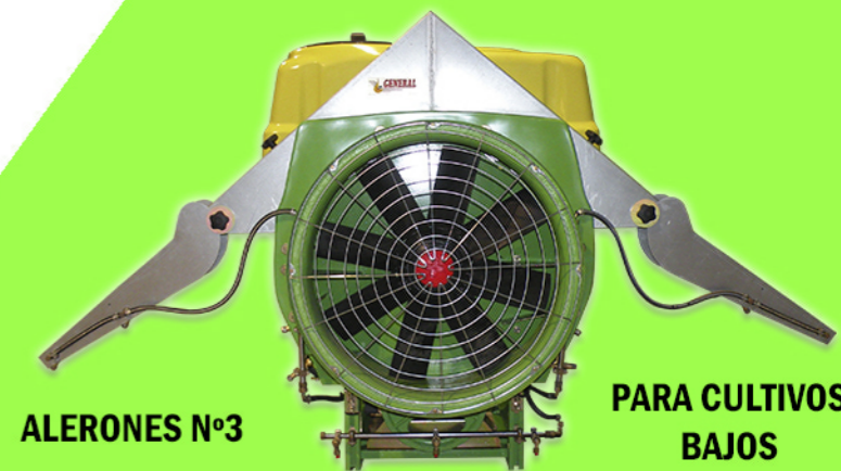
PARA CULTIVOS BAJOS