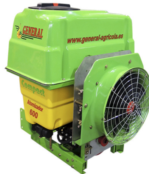
CANALIZADORES Nº4 CON ALERONES

* Fotografías orientativas, la máquina puede cambiar en función de capacidad y accesorios.