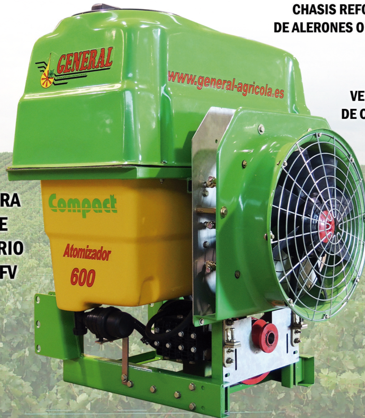
VENTILADOR 650Ø DE CAUDAL VARIABLE