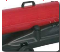
Filtro de gasoil con precalentamiento. Cod.: 02AC548