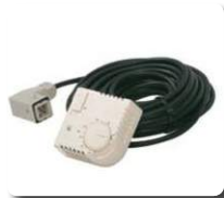
Termostato ambiente con 10m cable y conexión.