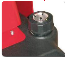
Indicador de nivel de combustible. Cod.: 02AC583