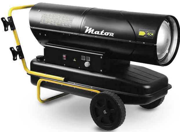
JETZ BGO 100