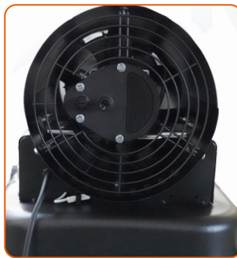
Manómetro de precisión y fácil acceso en modelos Jetz BGO-30 y BGO-50