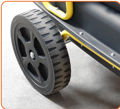
Ruedas de gran diámetro para una mejor maniobrabilidad