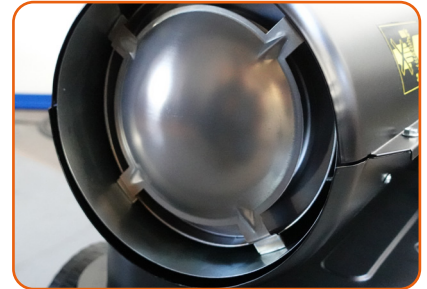
Cilindro de combustión reforzado con remaches.

Combustión perfecta con rendimiento al 100%