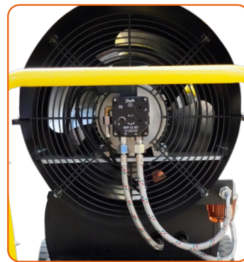
Bomba de combustible de alta calidad y fácil acceso en modelos Jetz BGO-70 y BGO-100.