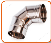
Curba de acero inoxidable de 90° - Ø120 mm Cod. 02AC421