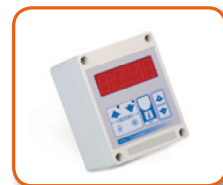
Termostato electrónico de precisión IP55 con display -10/+70°C sin cable. Cod. 02AC294