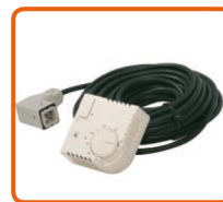
Termostato ambiente con 10m cable y conexión. Cod. 02AC581