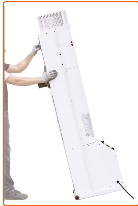
Incorpora ruedas para su fácil manejo