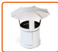
Eterminal de acero inoxidable Ø120 mm Cod. 02AC422