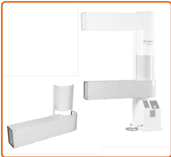
Adaptador de salida de aire Cod. 02AC672