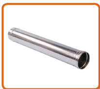
Tubo de acero inoxidable Ø120 mm - 1 m de longitud. Cod. 02AC420