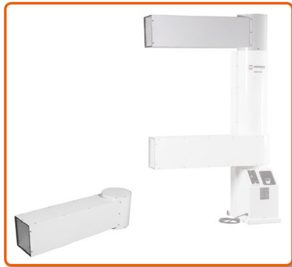
Adaptador de entrada de aire Cod. 02AC671