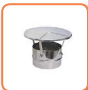
Sombrero chimenea acero inoxidable.