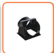
Adaptador 2 vías.

Mod. CONFORT 35 Cod. 02AC821 Ø 400 mm Mod. CONFORT 70 Cod. 02AC831 Ø 500 mm Mod. CONFORT 100 Cod. 02AC841 Ø 600 mm