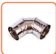
Codo 90° salida de aire acero inoxidable.