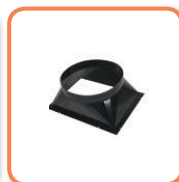
Adaptador 1 vía.

Mod. CONFORT 35 Cod. 02AC821 Ø 400 mm Mod. CONFORT 70 Cod. 02AC831 Ø 500 mm Mod. CONFORT 100 Cod. 02AC841 Ø 600 mm