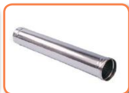
Tubo 1m. salida de aire acero inoxidable.