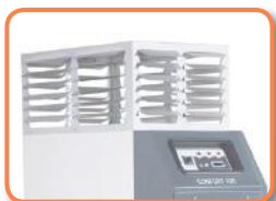
Salida de aire con láminas ajustables ( Plenum )