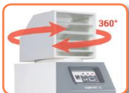
Cabeza salida de aire con láminas ajustables, rotación 360°.