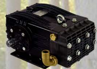
BOMBA DE PISTONES DE CERÁMICA