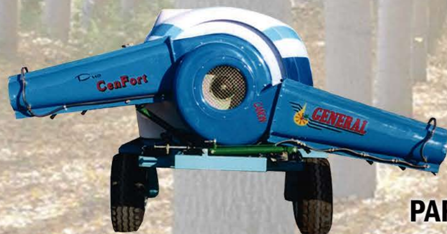
DISPOSICIÓN PARA HORTALIZAS