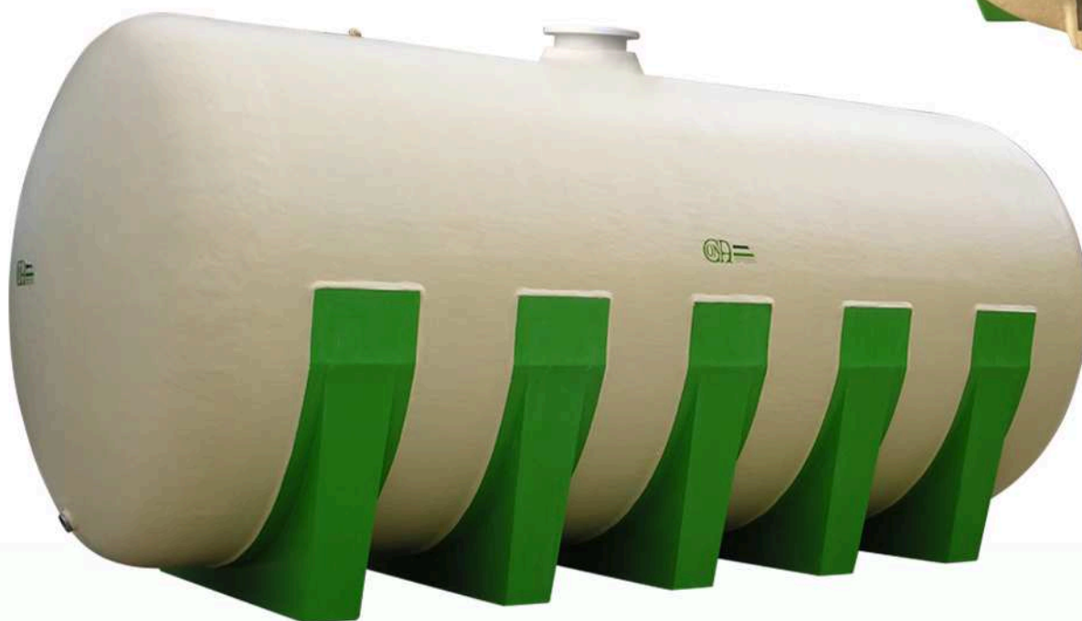
ARGOLLAS PARA ELEVACIÓN