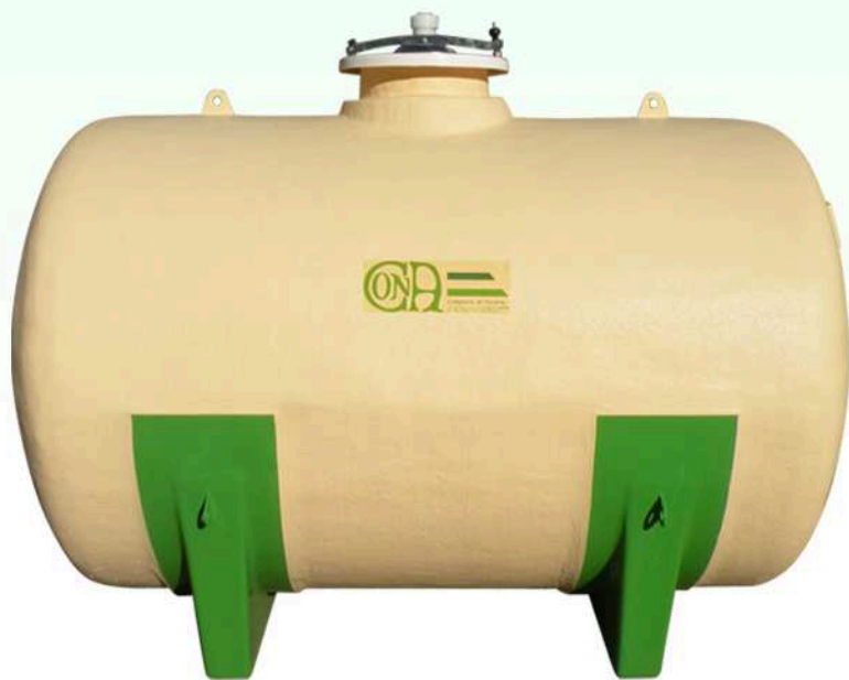
CUELLO SUPERIOR CON ROMPEOLAS INTERIOR Y EXTERIOR

CRTA. ALFARO S/N 31591 CORELLA (NAVARRA) TEL: 948 780 013 / FAX: 948 780 536 EMAIL: cona@conapoliester.es WEB: www.conapoliester.es