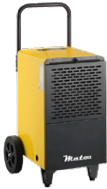
Dryer Pro BGD1701-50L