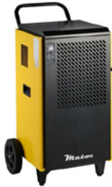
Dryer Pro BGD1702-70L