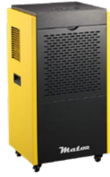
Dryer Pro BGD1701-90L