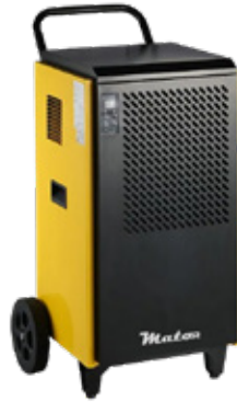
Dryer Pro BGD1702-X01-70L * CON BOMBA DE CONDENSADOS