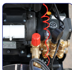
Cabezal de bomba de latón