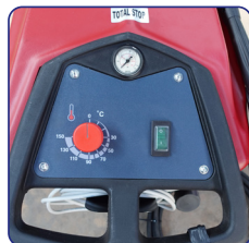
Sencillo cuadro de control de temperatura y on/off

Su característica principal es el tamaño compacto para desplazarse cómodamente.