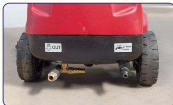
Fácil acceso a los conectores de mangueras