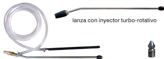
lanza con inyector turbo-rotativo