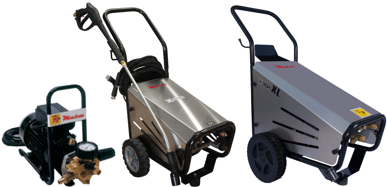
ATOM WATER GUN - 200