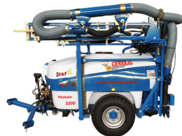
* Fotografías orientativas, la máquina puede cambiar en función de capacidad y accesorios.