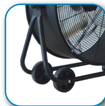
2 ruedas para su cómodo transporte