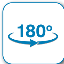
Diseñado para girar 180 grados

Con mantenimiento adecuado y limpieza regular, este ventilador industrial sobre ruedas está diseñado para durar muchos años.