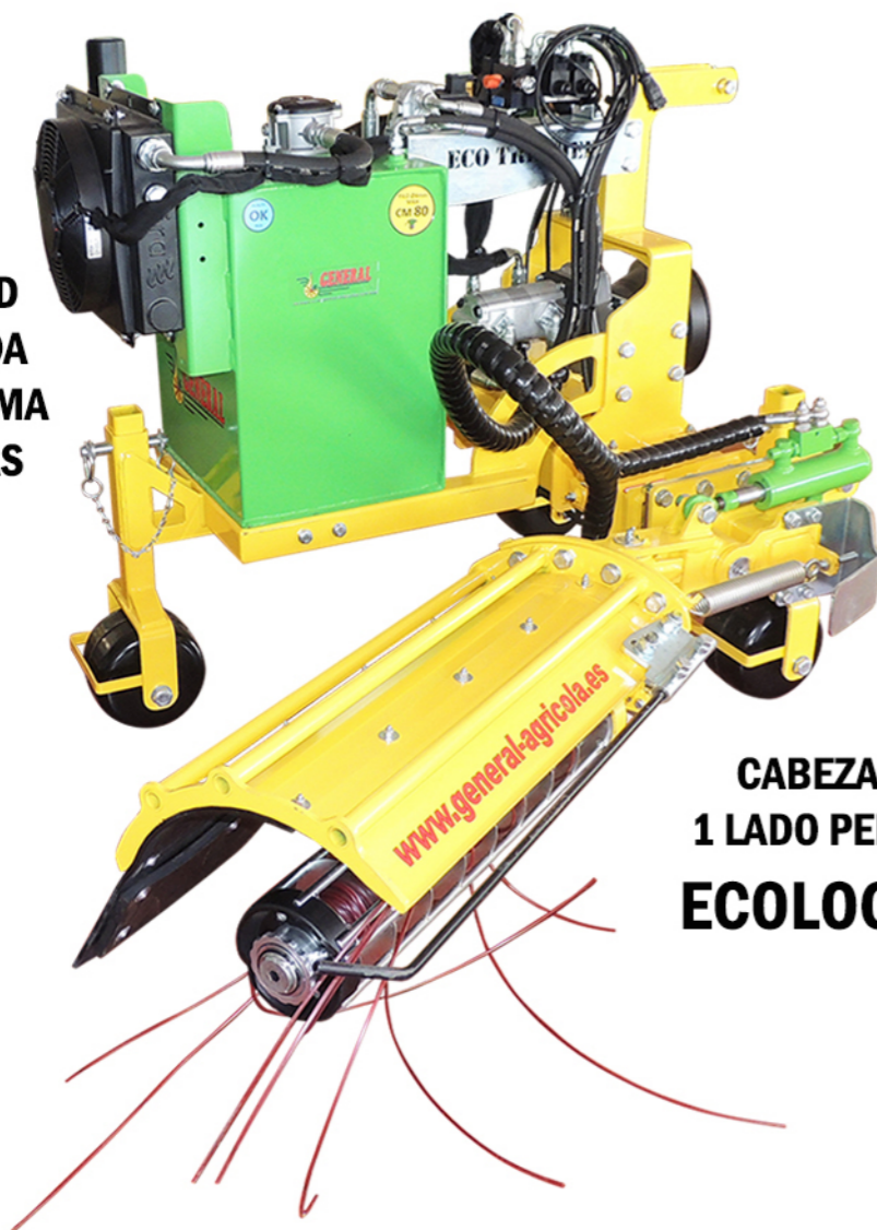
CABEZAL 1 LADO PELOS ECOLOGIC

ESTABILIDAD GARANTIZADA POR EL SISTEMA DE 3 RUEDAS